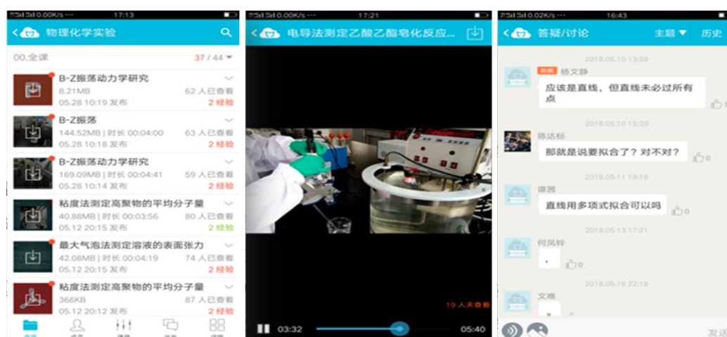
图2“互联网+手机APP”的应用教学模式

基础化学实验教学中心基于“互联网+”建设多层次信息化教学平台，改革教育供给侧的质量和效率从资源共享性——教学个性化——学习自主性三个功能